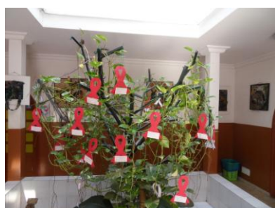
«L'arbre à Haïkus» de la 3eB.»